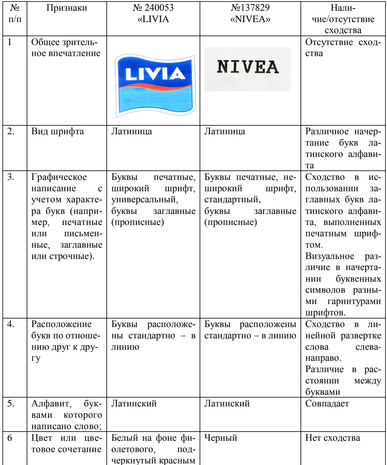
Таблица 2. Сравнительный анализ графического (визуального) сходства.

звука V в середине слова и близость звучания редуцированного безударного звука «А» в окончании не обладает различительной способностью, достаточной для индивидуализации обозначаемого предмета.