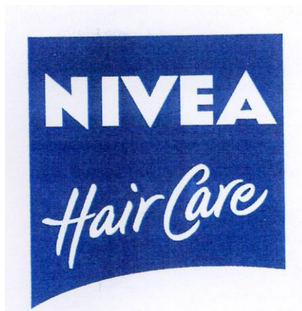
Рис. 5. Изображение внешнего вида товарного знака- № 724509

но более крупными буквами по сравнению со словами Hair Care , выполненными более мелким шрифтом, оригинального начертания букв Hair Care ; слово NIVEA расположено по центру над словами Hair Care . Словесный элемент «NIVEA Hair Care » выполнен в белом цвете на фоне синего цвета и является в целом доминирующим по отношению к изобразительному элементу: словесный элемент «NIVEA Hair Care » легче запоминается, чем изобразительный, на нем аккумулируется внимание реципиента при зрительном восприятии обозначения, в том числе благодаря контрасту белого и синего цветов