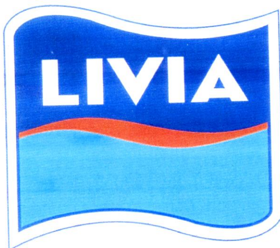
Рис. 2. Изображение комбинированного товарного знака № 240053 «LIVIA» 4 .

Словесный элемент рассматриваемого товарного знака выполнен широким шрифтом латинского алфавита – буквами белого цвета стандартного начертания в строчку на цветном фоне и представляет собой словесное обозначение «LIVIA».