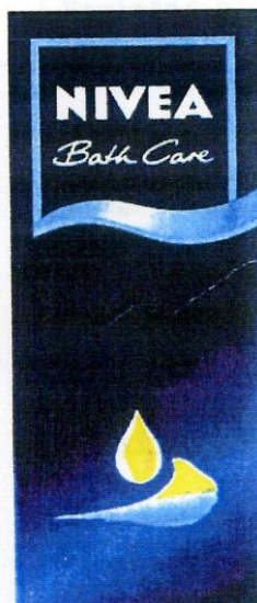
Рис. 4. Изображение внешнего вида товарного знака» № 702653

Изобразительный элемент в виде проекции геометрической фигуры прямоугольной формы с одной волнообразной стороной в структуре всей композиции представляет собой фон для словесного элемента, не обладает той степенью оригинальности, которая позволила бы квалифицировать его как доминирующий элемент комбинированного товарного знака, способного индивидуализировать товар.