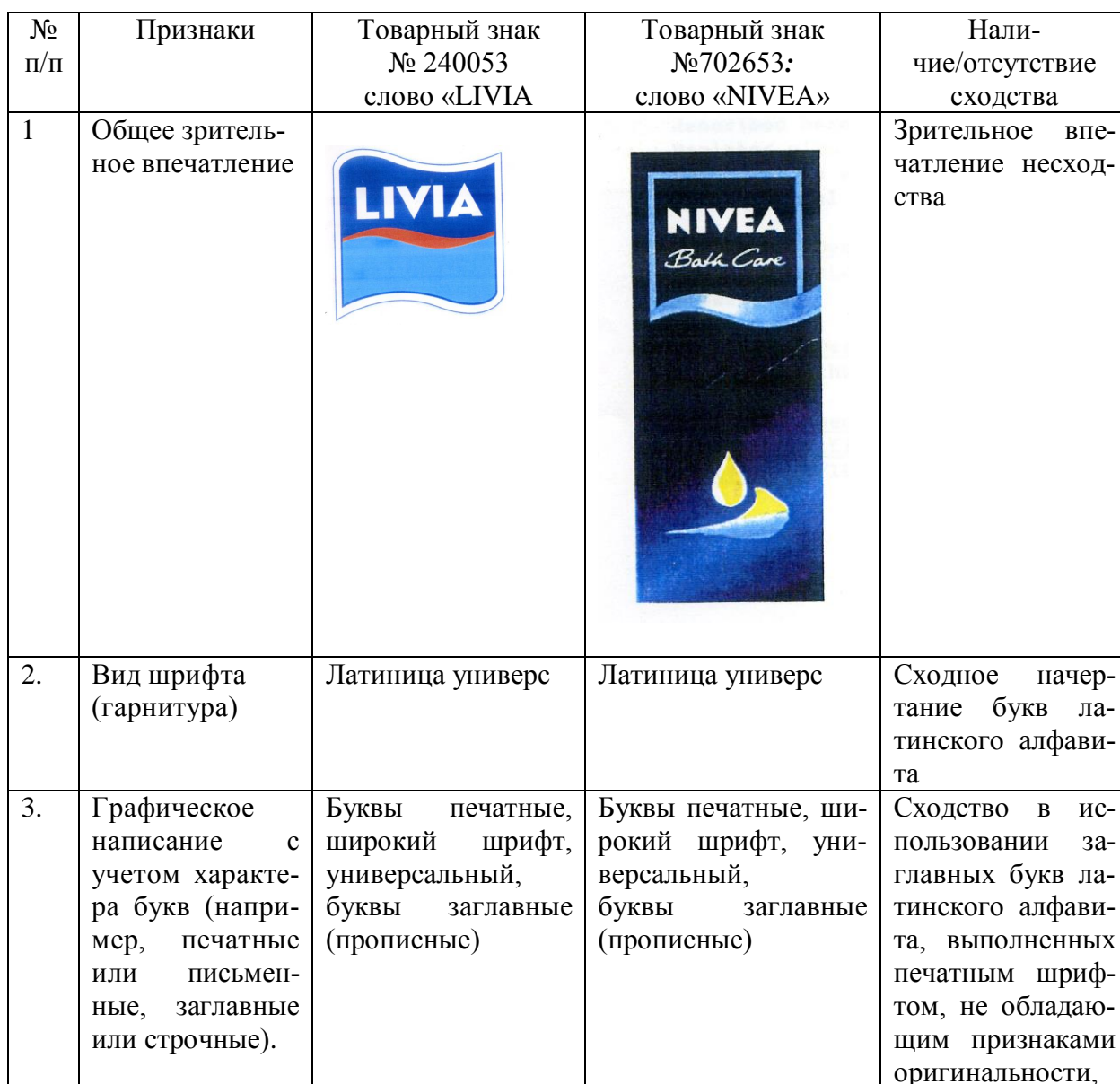
Таблица 5. Сравнительный анализ графического (визуального) сходства словесных элементов LIVIA и NIVEA в структуре комбинированных товарных знаков

Ниже в Таблице 5 приводится сравнительный анализ графического (визуального) сходства слова LIVIA и NIVEA с учетом графического решения последнего в противопоставленном товарном знаке №702653.