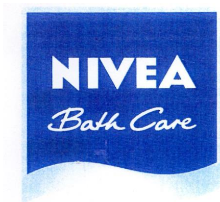
Рис. 6. Изображение внешнего вида товарного знака № 767468

Словесный элемент «NIVEA Bath Care» выполнен в белом цвете на фоне синего цвета и является в целом доминирующим по отношению к изобразительному элементу: словесный элемент «NIVEA Bath Care» легче запоминается, чем изобразительный, на нем аккумулируется внимание реципиента при зрительном восприятии обозначения, в том числе благодаря контрасту белого и синего