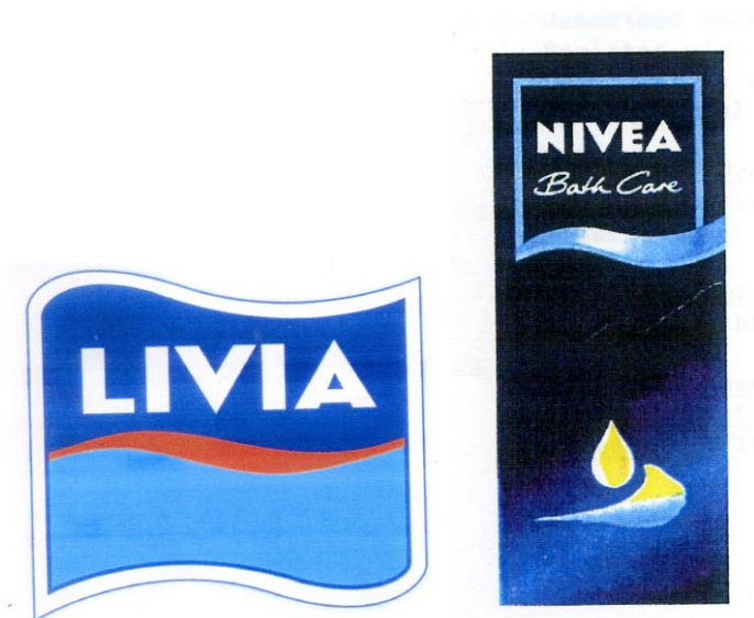
Рис. 8. Комбинированный товарный знак № 240053 «LIVIA» и товарный знак «NIVEA Bath care» № 702653

Сравниваемые комбинированные товарные знаки (Рис.8) включают доминирующие словесные элементы LIVIA и NIVEA Bath Care (где доминирует слово NIVEA).