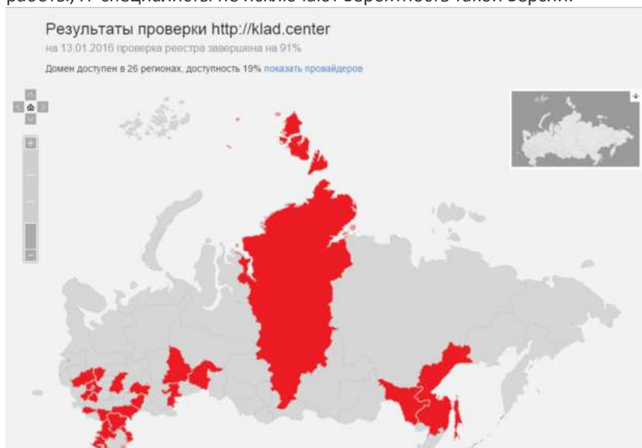
Домен klad.center доступен в 26 российских регионах

Кстати, в ноябре 2015-го сервер разработчиков ICM пережил мощнейшую DDOS-атаку и выдержал. В прокуратуре РТ считают, что нападение хакеров стало следствием эффективности их работы, IT-специалисты не исключают вероятность такой версии.