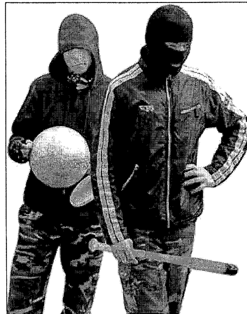
Молодежь Кавказа зачастую пытаются манипулировать преступные группировки.

Возможно, этого окажется недостаточно. Но это все-таки лучше, чем вообще игнорировать проблему.