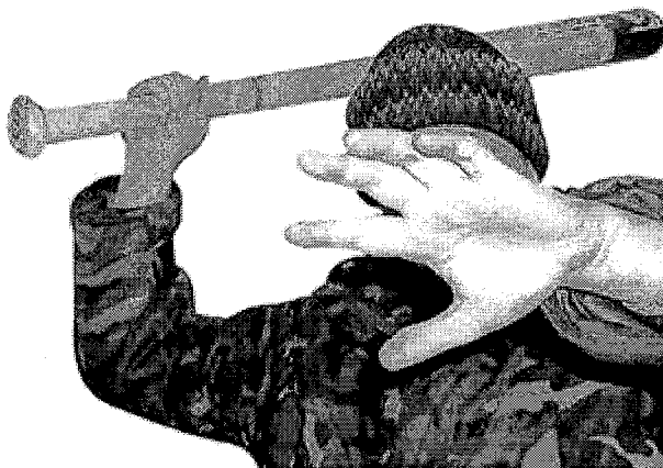
Молодежью Кавказа зачастую пытаются манипулировать преступные группировки.

Драки на национальной почве в московских вузах стали случаться с пугающей регулярностью. Студенческие форумы наполнены страхом и ненавистью. Приезжих с Кавказа обвиняют во всех тяжких - от бытового хамства до грабежей и вымогательств. Корреспонденты «Комсомолки» решили разобраться, что же происходит в студенческой среде.